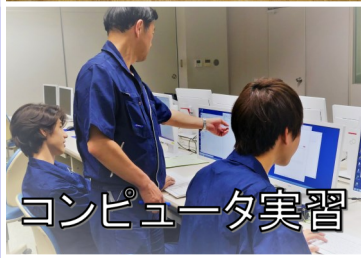
コンピュータ実習