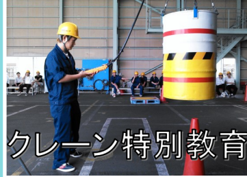
クレーン特別教育