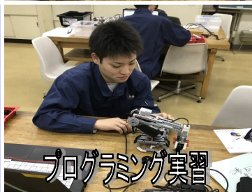
プログラミング実習