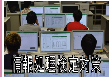
情報処理検定対策